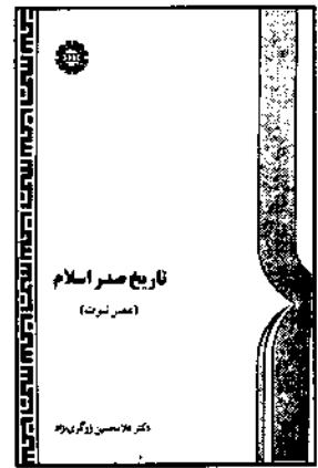
■ تاریخ صدر اسلام (عصر نبوت) ■ تالیف: دکتر غلامحسین زرگری نژاد ■ ناشر: سازمان مطالعه و تدوین کتب علوم انسانی دانشگاه‌ها (سمت)، تهران، چاپ اول، ۱۳۷۸

کتاب‌هایی که از دانشمندان عربی و غربی ترجمه شده نیز یکی به جهت تعصب و دیگری به لحاظ نگرش به پیامبر (ص) به عنوان فرستاده خدا و عدم توجه به ایمان مسلمانان نمی‌توانند راهگشای مشکلات موجود باشند. نویسندگان مارکسیست نیز با توجه به معطوف‌فحاشتن تمامی جریانات تاریخی به مسائل اقتصادی نمی‌توانند تئوری‌های مربوط به وضعیت سیاسی، اجتماعی و اقتصادی پیامبر (ص) و مسلمانان را تبیین و توجیه کنند. از آنجا که مجال مقایسه کتاب‌هایی که در سال‌های اخیر نوشته شده با کتاب مورد نظر این مقاله در این نوشته نیست به این نگاه اجمالی اکتفا