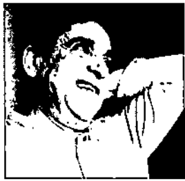
کنکاشی در دوره تمدن بورژوازی غرب

بیژانسی‌های ارتدوکس نیز هیچگاه خوشبینانه به اروپائیان یعنی همسایگان کاتولیک خویش ننگریستند. این دیدگاه را روس‌ها نیز نسبت به اروپائیان تا مدتها داشتند و آنگاه که پطر کبیر مقاومت آنان در برابر غربی شدن را در هم شکست، فصل نویسی در تاریخ آنان آغاز شد. از آن پس تمدن غربی برای آنان نه بیگانه که متحد تلقی شد و با قدرتی که تزارها در پی