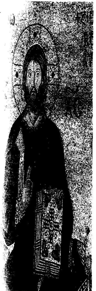
استانبول - ایاصوفیه - نقش موزائیک حضرت عیسی (ع)

◀ مطالعات بیزانسی به صورت جدی از اواسط قرن هفدهم در فرانسه شروع به رشد کرد.