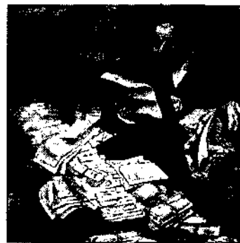
2. Les jeux de l'échange