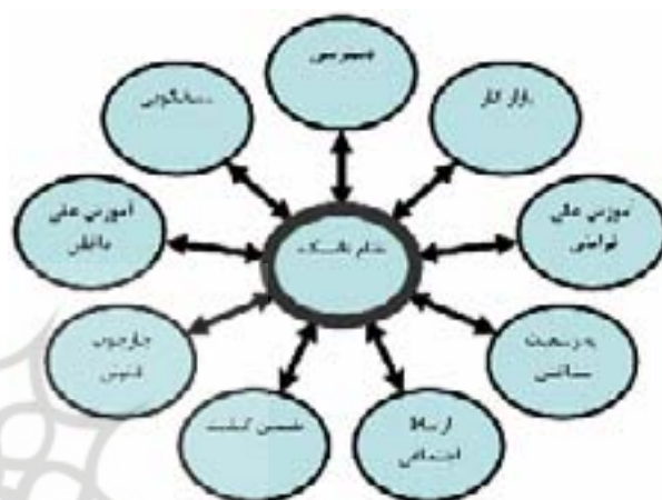
شکل شماره (۱) - فشارهای محیطی بر بدنه دانشگاه - (منبع: گرین، ۱۹۹۹).

انتزاعی دانشگاه وارد می شود و دانشگاه ملزم به آموختن روشهای رویارویی با آنهاست و این رویارویی یک گفتمان عمومی در سطح بالا بوده که تعیین کننده استقلال دانشگاه می باشد. به نظر گرین عوامل مختلفی بر استقلال دانشگاهی تاثیر گذار بوده، که نحوه و میزان اثر گذاری آنها نیز متفاوت است (گرین، ۱۹۹۹).