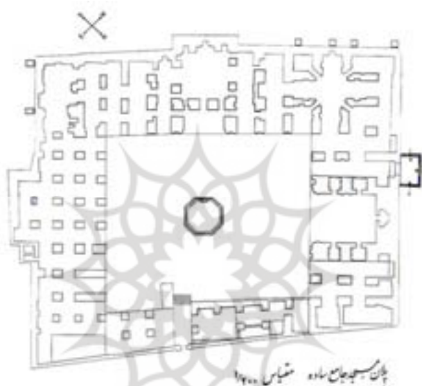
شکل ۴- پلان مسجد جامع ساوه، مقیاس ۱:۲۰۰

اوژن فلاندن در جای دیگر از سفرنامه خود می‌نویسد: در چهار فرسخی شهر ساوه مقبره شموئل پیغمبر واقع شده است. زمین‌های اطراف ساوه شن زار یا از نمک مستور است. انارهای ساوه در ایران خیلی اهمیت دارد بیش از سی‌چهل سانتیمتر محیط و رنگی سرخ تیره مخلوط به زرد دارد.» (اوژن فلاندن، ۱۳۵۶، ص ۱۲۲). مارکوپولو در سفرنامه خود، در مورد ساوه می‌نویسد: «... در ایران شهری است موسوم به (سبا) که از آنجا سه