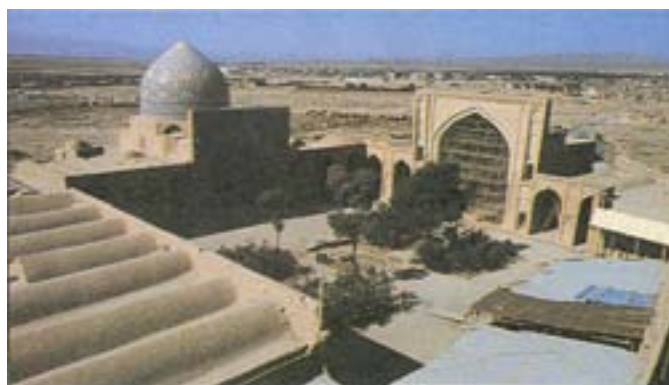
شکل ۲- نمای عمومی مسجد جامع ساوه

آن با بناهای مکشوفه دهانه غلامان ۱ قابل مقایسه است، اما بر اثر شواهد و ظواهر موجود در این بنا می‌توان نتیجه گرفت که طرح اولیه و ساخت و ساز فضای عمومی این مسجد مشتمل بر شبستان‌های طویل بوده که در اطراف حیاط مرکزی به طور یکپارچه ساخته شده است و خمیرمایه اصلی مصالح به کار رفته در این مجموعه شبستان‌ها که پیرامون حیاط مرکزی ساخته شده گل جبهه و خشت خام است، شکل شماره ۳ و ۴ نما و پلان مسجد جامع ساوه را نشان می‌دهد.» (مهریار، محمد، مجموعه مقالات اولین کنگره معماری و شهرسازی ایران، ص ۷۷۳).