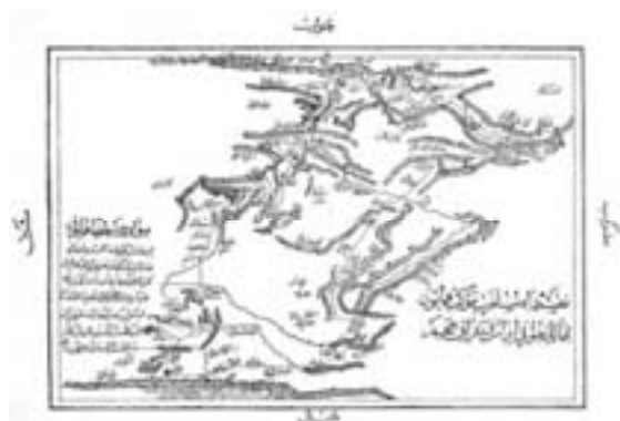
شکل ۹- نقشه خط سیر ناصرالدین شاه به عراق عجم از سفرنامه عرب عجم، ص ۱۹۴. (ساوه از روی ترسیم فن آ. اولتاریوس ۱۶۳۸-۱۶۳۷ م)