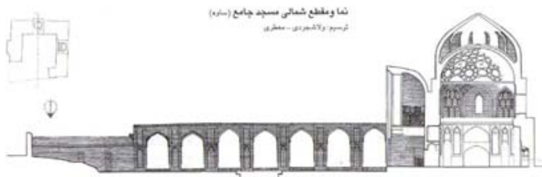
شکل ۳- نما و مقطع شمالی مسجد جامع ساوه (ولاشجردی و معطری، ۱۳۷۶)