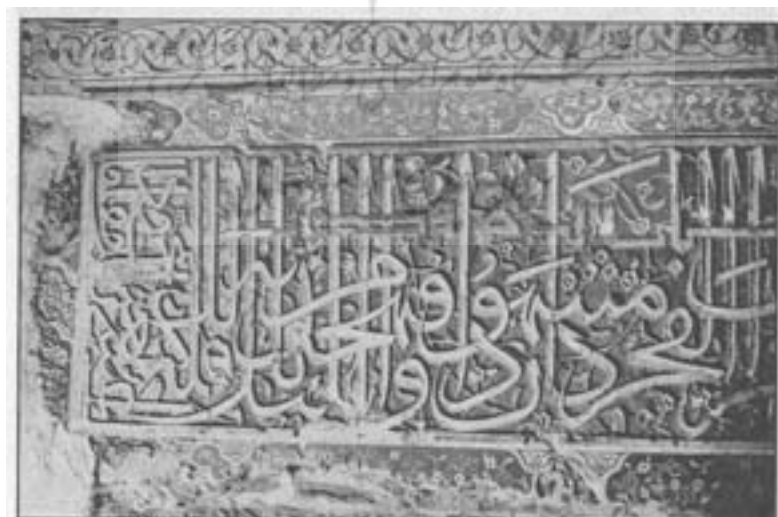
شکل ۵- مجموعه کتیبه‌های واقع در حاشیه محراب مسجد جامع ساوه که به خط ثلث و کوفی گجبری شده است.