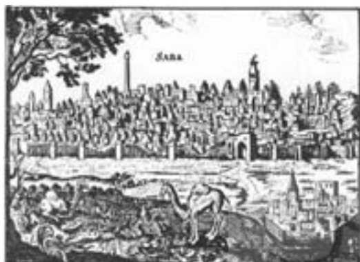
شکل ۸- ساوه از روی ترسیم فن آ. اولناریوس ۱۶۳۸-