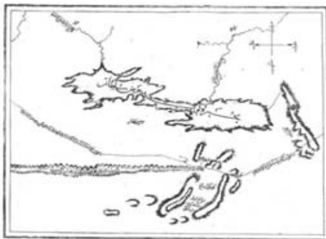
شکل ۱- نقشه دریاچه قم و موقعیت بحیره کویر حوزه سلطنت (فن.آ. اولناریوس ۱۶۳۸-۱۶۳۷ م)

بود. ساوه در قرن چهاردهم ۱ به دست حکمران محلی مرمت و ظاهراً حدود آن وسیع‌تر از سابق شد. با اینکه یکی از اماکن متبرک شیعیان یعنی قبر امامزاده اسحق برادر امام رضا (ع) در ساوه قرار داشت، با این حال شهر، یک شهر سنی بود، علاوه بر آن در قرن چهاردهم هم مانند این زمان قبر حضرت شموئیل پیغمبر را در حوالی شهر نشان می‌دادند (و. بارتولد، ۱۳۵۸، ص ۱۵۳۹).