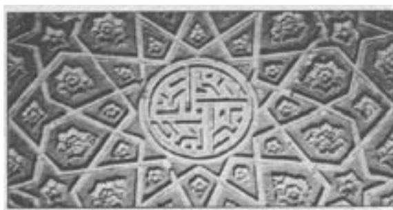
شکل ۶- کتیبه حاشیه روی طاق محراب مسجد جامع ساوه