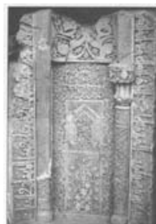
شکل ۷- کتیبه‌های محراب کوچک مسجد جامع ساوه

اصطخری از شهر ساوه به عنوان یک شهر مهم موصلاتی یاد می‌کند که بین راه‌های ری به همدان و قزوین به اصفهان واقع شده است. او فاصله همدان تا ساوه را سی فرسنگ و از ساوه تا ری را نیز سی فرسنگ ذکر کرده است (ایرج افشار، ۱۳۴۷، ص ۱۶۴). شکل شماره ۹ نیز نقشه خط سیر ناصرالدین شاه قاجار را در مسافرت به ممالک جنوبی ایران و عراق عجم نشان می‌دهد.