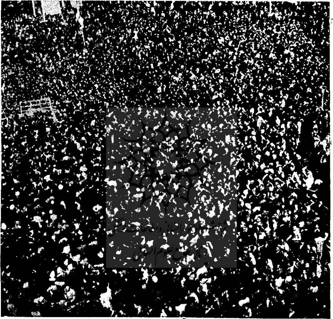
گوشه‌ای از انبوه جمعیت در تشییع بی نظیر پیشوای بزرگه عالم تشیع در صحن مقدس حضرت معصومه علیها السلام