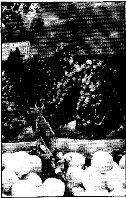
صادرات کلوخه های معدنی

با مشاهده ارقام جدول (۱) دومی یابیم که صادرات کلوخه های معدنی سهم کمتری را در کل صادرات غیر نفتی بخود اختصاص داده است. منظور از این کالاها، انواع سنگها، کرومیت، کلوخه های کانی فلزی و نظایر آن است. این گروه همواره بخش کوچکی از صادرات غیر نفتی را تشکیل میداده و در حال حاضر نیز سهم عمده ای در ایجاد درآمد ارزی ندارد و ارزش و سهم آن پس از انقلاب نیز با کاهش مواجه بوده است. عمده ترین تولیدات این بخش اکثراً بصورت خام صادر میشود و بدلیل مختلف از قبیل در نظر نگرفتن اهداف بلند مدت اقتصادی و عدم توجه کافی به این بخش، مشخص نبودن سیاست معدنی کشور و تعطیلی برخی از معادن به جهت جلوگیری از اتمام ذخایر کانی فلزی و حفظ آن برای کارخانه های ذوب فلزی آینده، نارسائی شبکه حمل و نقل کشور و عدم استفاده از تأسیسات بعضی بنادر مهم صادراتی به دلیل وقوع جنگ تحمیلی و... صادرات آن کاهش یافته است.