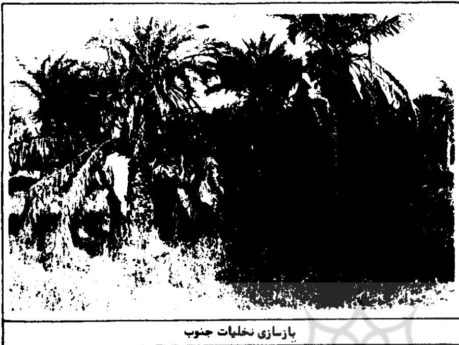
بازسازی نخلیات جنوب