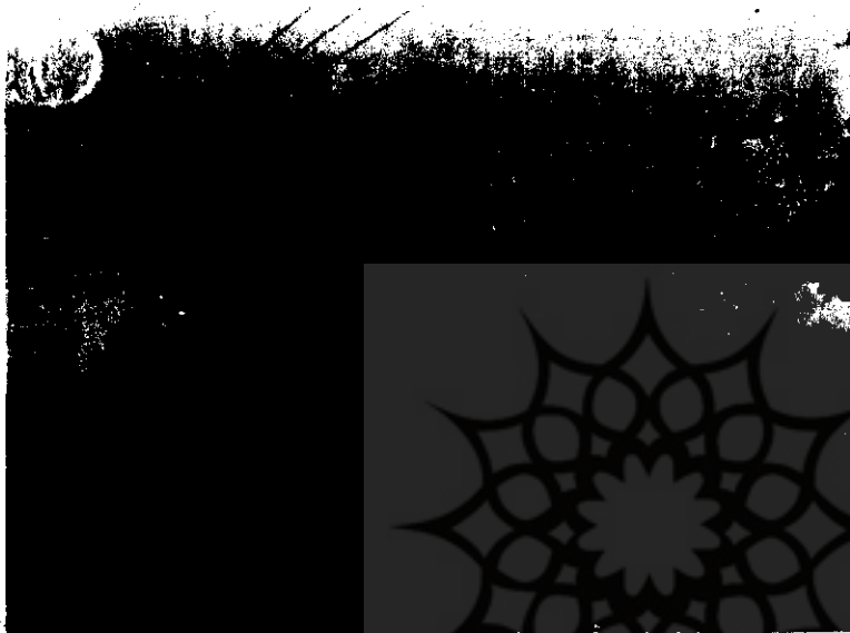
برق رسانی روستاهای مناطق جنگزده روستائی

ابتدای سال ۶۱ در تازه آباد واقع در ثلاث باباجانی در شمال باختران مستقر شده اند.