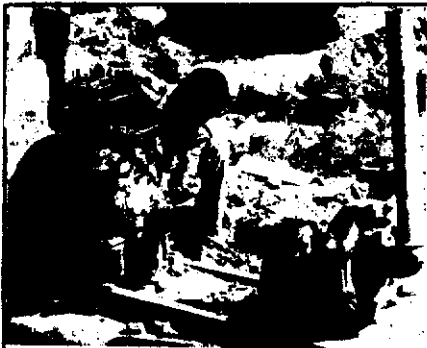
۵- بازسازی موتور پمپ‌های کشاورزی

۹۹ مورد، کشیدن دندان ۱۴۸ نفر، ختنه افراد خرد و بزرگسال ۲۷۴ نفر، درمان و اعزام موارد اورژانس ۱۱۴ نفر، احداث توالت بهداشتی ۸۵۵ مورد، توزیع سنگ توالت ۲۶۰ مورد، توزیع لوازم بهداشتی و نصب جعبه کمک‌های اولیه ۱۱۰۰ مورد، بهداشتی کردن محیط ۱۳ مورد، آموزش بهداشت و کمک‌های اولیه ۲۷۱ نفر، بهداشتی کردن آب آشامیدنی و به سازی و نوسازی چشمه ۷ روستا، سوزاندن زباله ۷ روستا، تهیه شناسنامه بهداشتی ۲۷ نفر، نمایش فیلم بهداشتی ۶ حلقه.