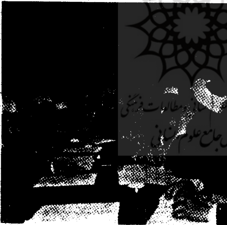
در این تصویر که یکی از جلسات دارالتقریب است علامه قمی و سایر علمای اسلامی از جمله استاد عبدالمجید سلیم و شیخ محمود شلتوت دیده می شوند.

زود گذر گذاشته میشود و با تغییر عواطف تغییر می یابد.