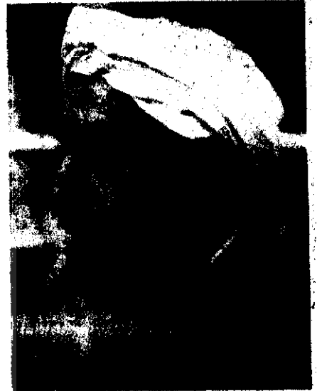
پیشوای مصلح علامه سید محمد تقی قمی

هت مصلحان سنی و شیعه انجام شده است. علامه سید محمد تقی قمی در سال ۱۳۱۷ شمسی پس از مهاجرت به مصر «دارالتقریب بین المذاهب الاسلامیه» را در جامع الازهر بنا نهاد که هدف آن ایجاد وحدت و نزدیکی بین مذاهب اسلامی بود. این اقدام مورد استقبال بزرگتی چون شیخ