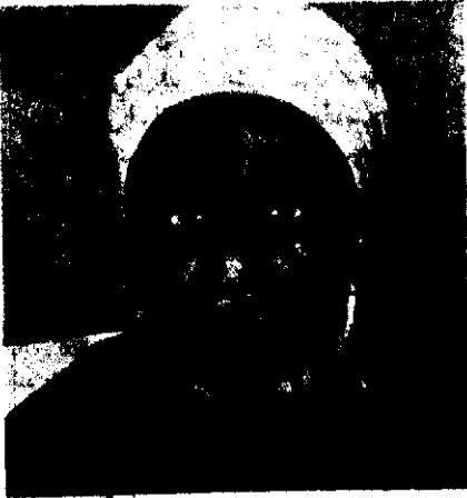
شیخ محمود شلتوت که از بنو تاسیس دار التقریب به جمعیت تقریب پیوست و فتوای تاریخی جوایز پیروی از مذهب اهلیمه را صادر نمود

❁ انگیزه تشکیل دارالتقریب در حقیقت سنی نمودن شیعیان و یا شیعه نمودن سنی ها نبوده بلکه نزدیک نمودن افکار علمای اسلامی به یکدیگر و به تبع آن رفع اختلاف در بین امت اسلام بود.