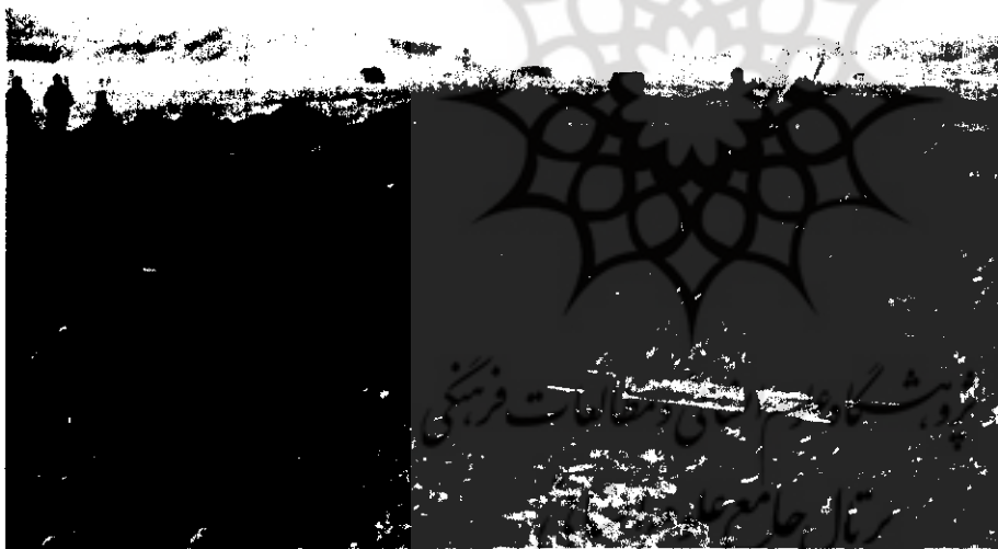
جهدسازندگی برای دفن مزدوران بعثی در نقاط مختلف جبهه ها اقدام به ایجاد گورستان می کنند

احداث شد. اخذات این جاده بدلیل مدت محدود ده روز، شرایط پارتندگی وزمین رسوبی وسست بسیار مشکل بود.