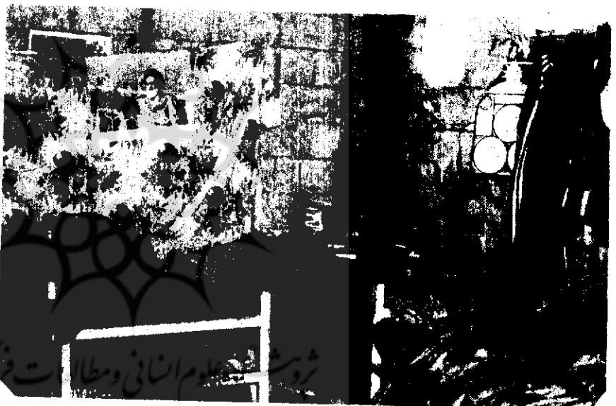
یکی از سنگرهای رزمندگان امل در جنوب لبنان

در تاریخ ۶۰/۱۲/۵ بطرف جنوب لبنان حرکت کردیم. از شهرهای صیدا و صور رد شدیم و هر لحظه با دیدنیهای تازه تری آشنا میشدیم. منطقه جنوب لبنان بحدی سرسبز و خرم است که انواع و اقسام میوه‌ها اعم از میوز و پرتقال و زیتون و... پرورش می‌یابد. انگلیس و فرانسه استعمارگر سالهای سال این منابع طبیعی را به غارت میرساند. هم اکنون نیز اسرائیل برای تخلیه جنوب از شیعیان، روستاها را به توپ می‌بندد و بسیاری از روستاها تخلیه شده و مردم سرگردان شده‌اند. مراکز نظامی امل و فلسطینها در مناطق مختلفه پنجم می‌خورند و مردم از حمله احتمالی اسرائیل نگران هستند. مردم منطقه جبل عامل پراختی می‌توانند خود کفا شوند و اساساً لبنان کمزوری است، که از نظر کشاورزی بسیار قوی