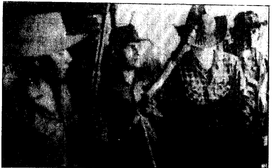
جریکهای رزمنده السالوادور سلاحهای خود را به نمایش می گذارند

ایجاد فاجعه بیش از پیش گسترده میشد، سرمایه گذارهای خارجی ضربه های مهلکی را بر اوضاع اجتماعی این کشور وارد ساخت و در حقیقت میتوان گفت که روستاها به تسخیر فنودالها و زمیندارهای بزرگ با پشتوانه سازمانهای کشاورزی امریکائی در آمدند و شهرها نیز تحت انحصار صنعت وابسته و کمپانی ها و شرکت های ایالات ماحده قرار گرفتند.