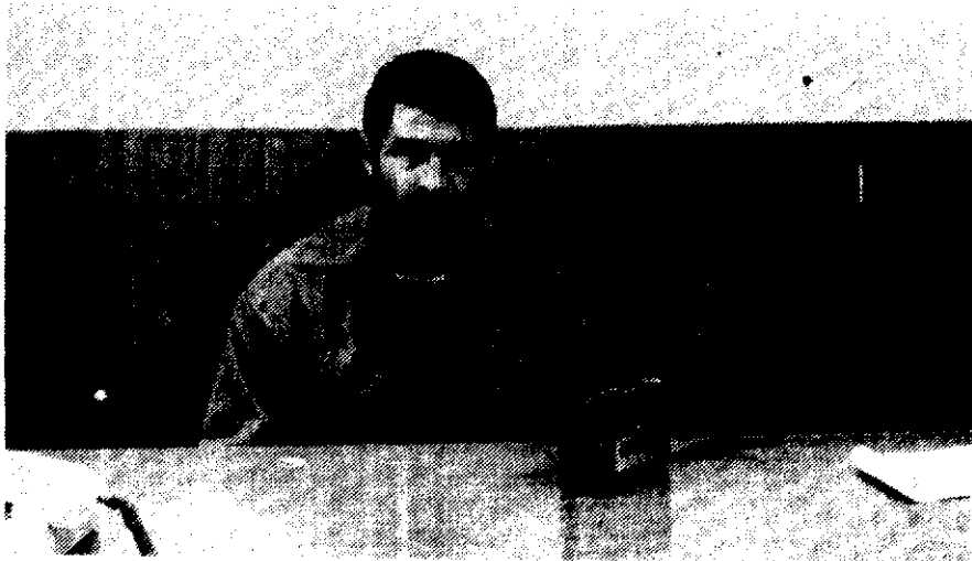
برادر عرب نژاد فرمانده سپاه پاسداران مهاباد