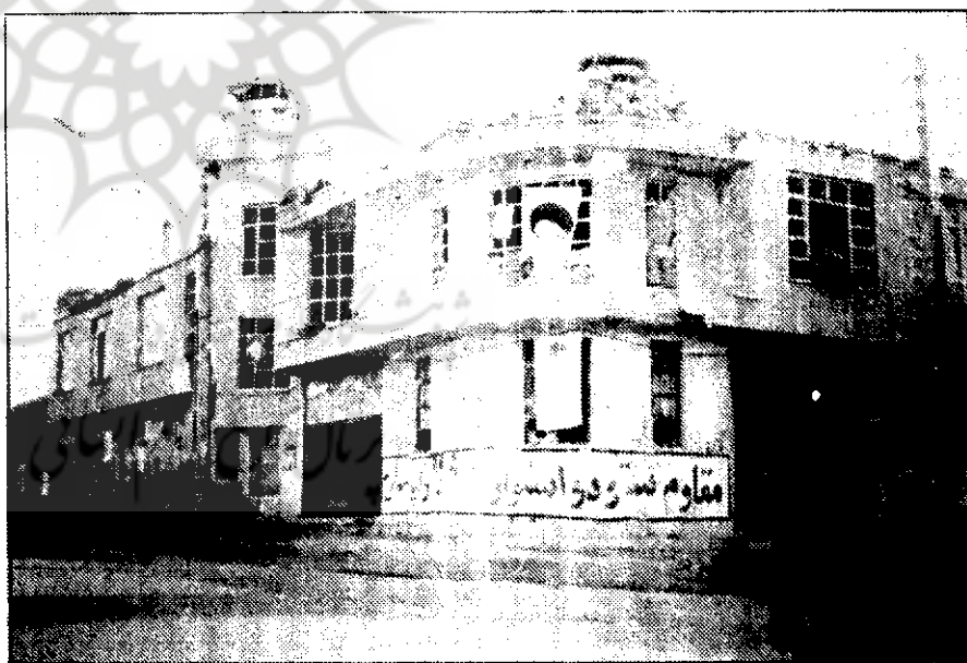
(یکی از مقرهای گروههای اسلامی در مهاباد)

احساسات مردم پخش گردیده است. این گروهکها اعلام می کنند که در شهر نمی جنگند اما روز بعد به شهر آمده و کتک و کشتار براه می اندازند و انسانهای بیگناه را که سلاحی جز سلاح ایمان ندارند را شهادت می رسانند تاکنون بسیاری از جوانان مسلمان کرد برادران جهاد سازندگی، سپاه و ارتش بدست این جنایتکاران ناجوانمردانه شهید شده اند این مساله واقعی است که در منطقه بیش از پیش آشکار شده و