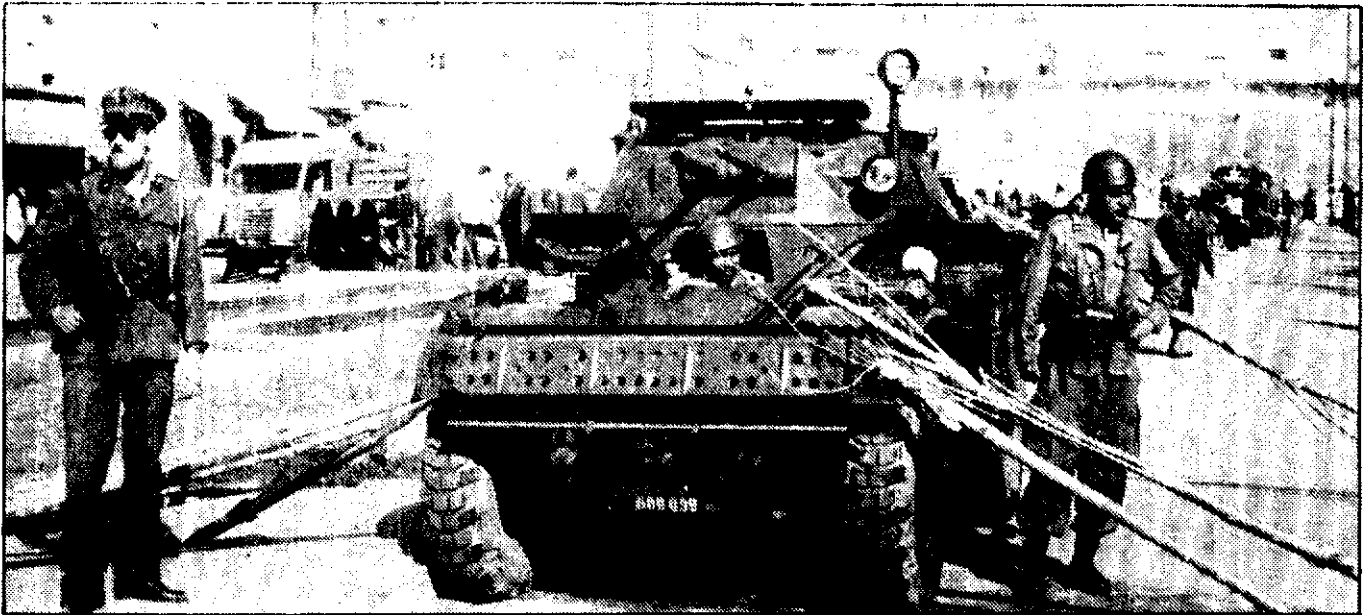
نیروهای نظامی مراکش مستقر در کازابلانکا بعد از تظاهرات عظیم مردم در بیست خرداد.