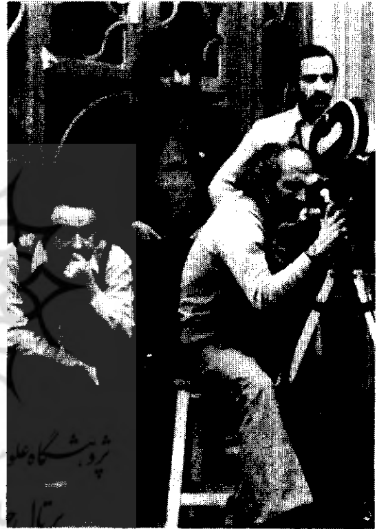
بیت صحنی شانزده آکتیاب

نداریم. اقتصاد بر سینما حکم فرما است و اگر شما بگویید که من می‌خواهم برای دلم فیلم بسازم و اصلاً به برگشت پولش فکر نمی‌کنم کسی به شما پول نمی‌دهد الان وقتی شما فیلمی را می‌خواهید بسازید اولین چیزی که فکرش را می‌کنید مخاطب است. فیلم‌هایی مثل شانزده آکتیاب، بعد از ۲۵ سال که از ساخت آن می‌گذرد، هنوز وقتی در خارج نشان می‌دهند، مردم می‌گویند که این فیلم می‌تواند روی پای خودش بایستد و کهنه نشده است، فیلم موجودیت خودش را دارد. زندگی‌اش جدا از من است.