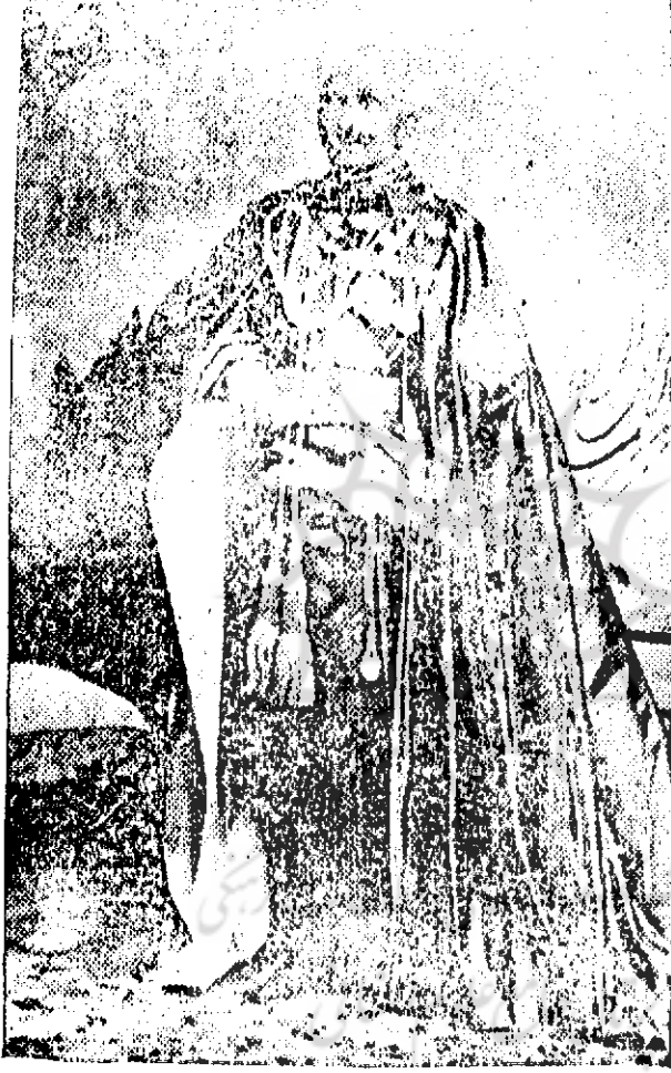
حضرت اشرف مہاراجہ سرکشن پرشاد صدر اعظم سلطنت دکن