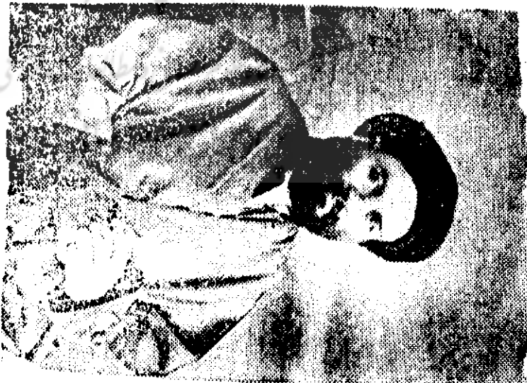
حضرت سلطان ادیب ارب فاخرا آقاہی داعی الاسلام