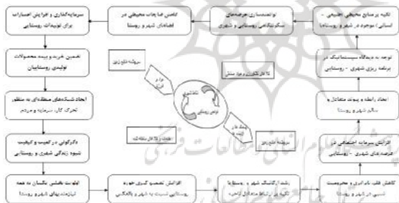
شکل ۱- ساختار روابط سالم و متعادل شهر و روستا در راستای توسعه پایدار ناحیه‌ای

به وجود آمده‌اند نه نهادارای وابستگی‌های متقابل فضایی بوده که منجر به شکل‌گیری جریان‌ها و کنش متقابل میان آن دومی گردد (قادرمرزی، ۱۳۸۵: ۴۵)، بلکه این روابط و پیوندها در یک راهبرد توسعه یکپارچه منطقه‌ای به عنوان ابزاری برای کاهش فقر روستایی، ایجاد پیوند فضایی میان فعالیت‌های کشاورزی و بازارهای مصرف، توسعه ظرفیت ارائه خدمات و ایجاد مشارکت میان بخش‌های دولتی و خصوصی، جذب نیروی مازاد بخش کشاورزی در بخش‌های صنعت و خدمات می‌تواند موجبات توانمندسازی روستاییان و جلوگیری از مهاجرت آنان به شهرها را فراهم بیاورد (Overbeek and Tomas, 2005; et, 2005). همچنین اینگونه روابط متقابل موجب «شهرگرایی در نواحی روستایی» به واسطه حرکت جمعیت و افراد از شهرها به روستاها، گسترش و پخش ایده‌ها و شیوه‌های زندگی شهری در نواحی روستایی شود و در روند تحولات جمعیتی این نواحی ایجاد دگرگونی نماید (رضوانی، ۱۳۸۱: ۸۶-۸۵). بنابراین روابط شهر و روستا و نحوه تعاملات بین آنها تأثیر بسزایی در تغییرات اجتماعی-اقتصادی و جمعیتی از جمله افزایش و یا کاهش مهاجرت، رشد جمعیت، رفح و یا کثرت فقر، اشتغال، تغییر در ساختار فرهنگی و مهم‌تر از همه برقراری تعادل و یا عدم تعادل میان اجزا و خرده سیستم‌های (انسانی-طبیعی) موجود در درون ناحیه دارد. از این رو لازم است در تمام سطوح برنامه‌ریزی اعم از ملی، منطقه‌ای و محلی ضمن تلاش به منظور برقراری تعادل‌های محیطی در بین کلیه اجزا درونی و بیرونی ناحیه، با نگرشی یکپارچه به شهر و روستا، روابط و پیوندهای فضایی میان این دو کانون سکونتگاهی به صورت سیستماتیک در جهت دستیابی به یکپارچگی کارکردی و توسعه پایدار ناحیه مورد مطالعه و بررسی قرار بگیرد. (شکل ۱).