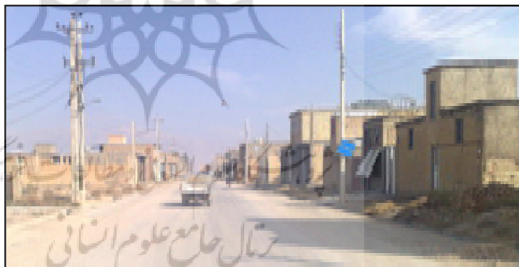
تصویر ۱ - تقلید و استفاده از شکل و نمای ساختمان‌های شهری در روستای فتح‌آباد

از منظر نوع مسکن، در این روستاها به دلیل افزایش دامنه ارتباط و تعاملات روستاییان با شهر و اطلاع یافتن از سبک‌ها و الگوهای ساختمان‌سازی و نیز دخالت نهادهای دولتی همچون بنیاد مسکن در شکل مسکن و عرصه‌های کالبدی روستاها با یک دگرگونی و تحول اساسی در فضای هر سه روستا به تبعیت و تقلید از الگوهای کالبدی شهر مرودشت و حتی شیراز روبه‌رو هستیم. (عکس ۱ و ۲). در این میان فرایند اجرای طرح هادی در روستاها خود مزیدی بر این تجانس و هماهنگی کالبدی- فیزیکی عرصه روستاها با شهر مرودشت و میل به ایجاد افزایش روابط متقابل بین این سکونتگاه‌ها شده است.