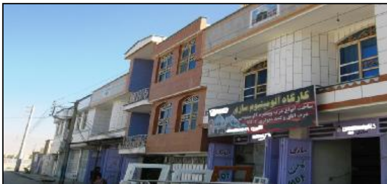
تصویر ۲- تقلید و استفاده از شکل و نمای ساختمان‌های شهری در روستای کناره