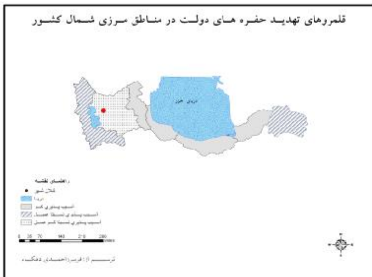
نقشه ۱: حفره‌های دولت در شمال کشور