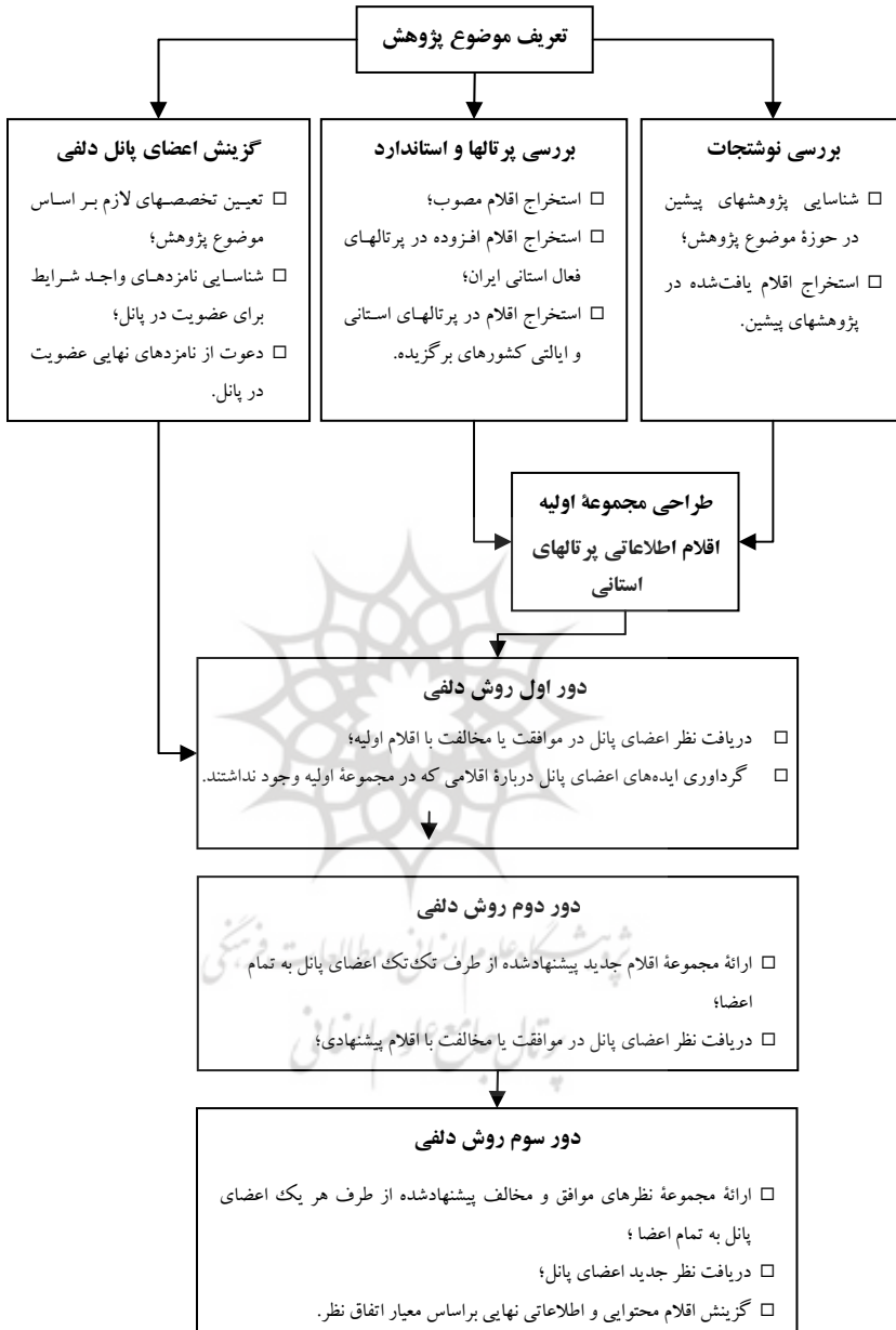
شکل ۱. فرایند و مراحل پژوهش

درباره یک موضوع خاص دست یابد (Linston and Turoff 1975, 10).