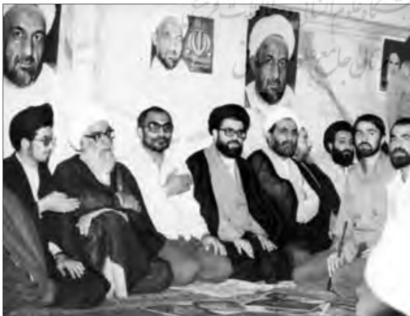
ایستادگاری آیت‌الله قدوسی در مدرسه عالی شهید مطهری

ادغام شدند و ۶، ۵ ماه بعد از این هم، ما تحویل دادیم. قبل از ایشان آقای هادوی آمد که حضرت امام نسبت به ایشان آشنایی داشتند. وکیل متدین و خوبی بود و در زمان شاه در مقابل ظلم‌ها ایستادگی کرد و در زمانی که دادستان قم بود، ایستادگی کرد و حکم تبعید امام را امضا نکرد. البته دوستانش شناخت خوبی از ایشان داشتند و برای حضرت امام هم نقل کرده بودند و برای اولین بار به عنوان دادستان کل انقلاب منصوب شد. ایشان یک قاضی دادگستری سابقه دار بود، ولی در عین حال روحیه مناسب برای شرایط انقلابی را نداشت. انقلاب ملزوماتی دارد و مثلاً ایشان گاهی از بعضی از کارهای کمیته‌ها که البته آن زمان هنوز خیلی فعال نشده بودند، ناراحت بود و نتوانست آن طور که باید، به کار ادامه بدهند. البته مختصر تشکیلاتی ایجاد شد، مثلاً دادگاه تهران اول در اوین مستقر بود. بعداً خود آقای قدوسی در آنجا کار می‌کرد و آقای آذری هم دادستان تهران بود، ولی مشکلاتی بین دادستانی کل و دادگاه تهران بود و به هم ریختگی دیده می‌شد. بالاخره آقای هادوی نتوانست آن حاکمیت دادستانی را در دادرها و شهرها و به‌خصوص در تهران ایجاد کند و لذا منجر به استعفای ایشان شد. قضات دادگاه‌های انقلاب کشور که همه از روحانیون بودند و غالباً هم از قم رفته بودند، نسبت به شهید قدوسی شناخت داشتند و عده‌ای از شاگردان مدرسه حقانی