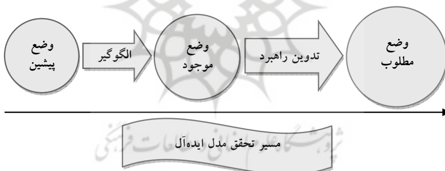
شکل ۱: مراحل روشی حکومت زمینه‌ساز

چارچوب تحلیلی مناسب و مورد استفاده در نوشتار حاضر، الگوی «وضع پیشین، وضع موجود و وضع مطلوب» است. بدین ترتیب که در راستای کارآیی حکومت زمینه‌ساز، در صورت شناخت «چگونه بودن» عملکرد دولت می‌توان در مرحله بعد درباره «چگونه باید بودن» آن نظریه‌پردازی کرد. در این روش، عملکرد حکومت زمینه‌ساز و تصمیم‌گیران به دو مرحله وابسته به هم تقسیم می‌شود: ۱. مرحله شناخت و بررسی وضع موجود و مشکلات حکومت. در این مرحله، وضع موجود حکومت و مشکلات عمومی جامعه شناسایی و بررسی خواهد شد. ۲. مرحله ارائه راه‌حل‌ها و راهبردها در راستای حل مشکلات و رسیدن به وضع مطلوب با توجه به قرآن کریم. در این مرحله، پس از شناخت مشکل، در راستای حل مشکلات و رسیدن به مدل ایده‌آل، راه‌حل‌ها و راهبردها با پیروی از آیات قرآن کریم ارائه خواهد شد.