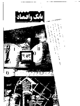
بانک و اعتماد

دولتی را وادار به بهبود خدمات و استفاده بیشتر از تکنولوژی‌های جدید نموده‌اند.