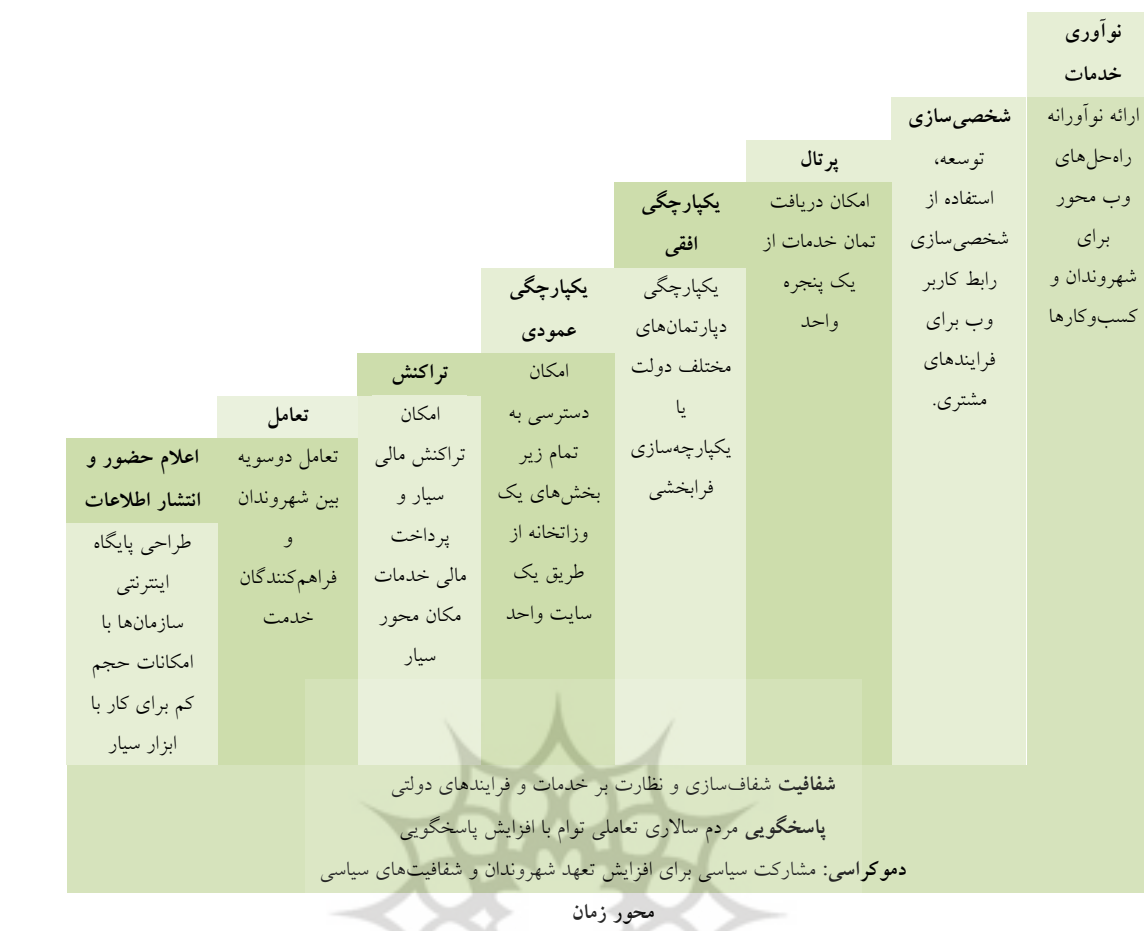
شکل ۲) مدل بلوغ دولت سیار

مرحله چهارم، یکپارچه سازی عمودی: در این مرحله دولت ها باید به منظور استاندارد سازی و اجرای یکپارچه سازی درون سازمانی، فرایندهای موجود را مهندسی مجدد کنند. اجرای مهندسی مجدد از پیچیدگی خاصی برخوردار است زیرا در این مرحله باید تغییراتی زیر بنایی و اساسی در فرهنگ سازمانی، فرایندها و مسئولیت ها در جهت کاهش گلوگاه های فرایندی و حذف فرایندهای اضافی بوجود آید. در این مرحله سیستم های گوناگون در سطوح مختلف (عمودی) یکپارچه می شوند. یکپارچگی عمودی در وظایف یکسان، ولی در سطوح مختلف دولتی اتفاق می افتد.