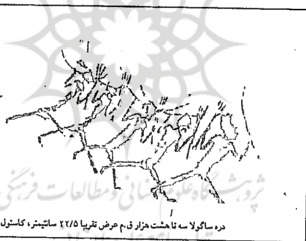
دره ساگولا سه تا هشت هزار ق.م عرض تقریباً ۲/۵ سانتیمتر، کاستول اسپانیا

□ با توجه به مدارک به دست آمده تا ۴۰ هزار سال پیش از میلاد نمی‌توان به وجود آثار هنری به مفهوم اخص و تلاش انسان در راه ساختن سمبل‌ها و نشانه‌های هنری اشاره کرد. این عامل سبب شده است تا پینداریم هنر در آغاز سیر، کندی داشته است.