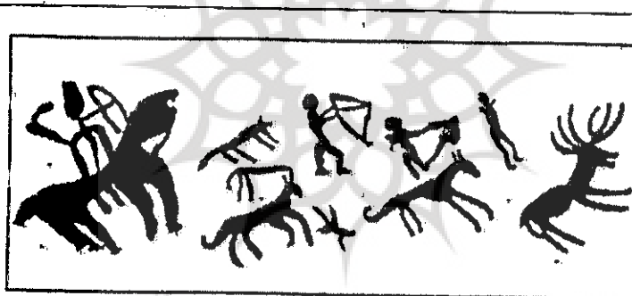
نقاشیهای غار همیان، کوه‌دشت لرستان

هنرمند باستان از میان دهها غارهای مختلف در نواحی لرستان به دنبال مناسب‌ترین مکان برای استقرار و نیز خلق آثار خویش بوده است.