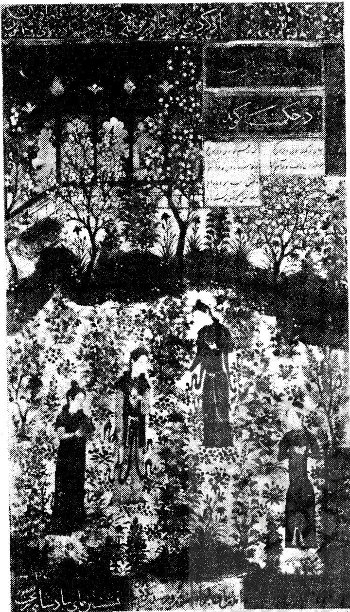
دیدار همای از همایون در باغ سلطنتی - صحنای از یک کتاب دستنویس گمشده. مکتب هرات (حدود ۱۴۳۰ میلادی - ۸۲۴ هجری)