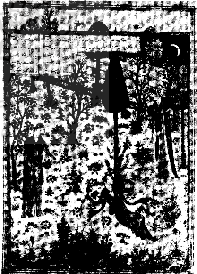
دیوان خواجوی کرمانی. همای و همایون مکتب بغداد (۱۳۹۶ میلادی- ۷۹۹ هجری) اثر جنید نقاش موزه بریتانیا

۹۵۳ تهران، سپهسالار ۴۱۵/۴، در پنج گنج او.