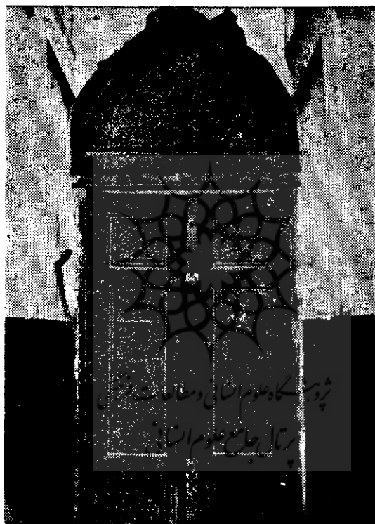
در امامزاده اسمعیل

مقبره معروف بشعنا که در قسمت شمالی بقعه امامزاده اسمعیل، میان آن بنا و بقایای مسجد سلجوقی، موجود است و کتیبه ای که روی آن از زمان صفوی باقی