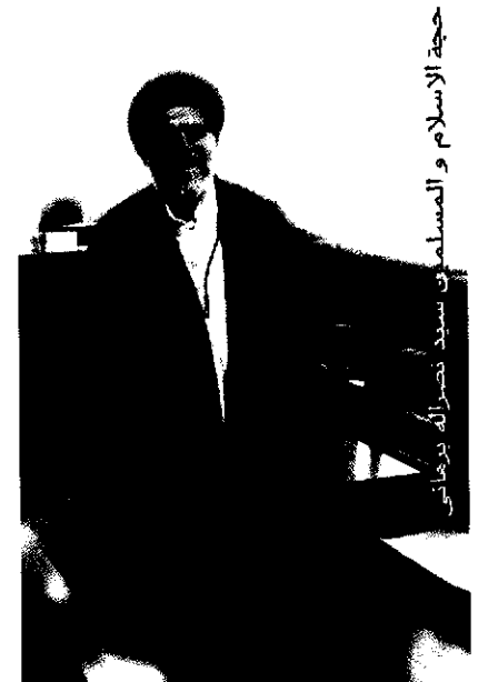
حجة الاسلام و المسلمین سید نصرالله برهانی

قضائی در استان تهران شایسته سالاری در نظر گرفته شده است؟