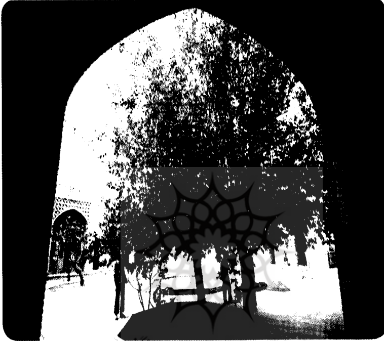
پژوهشگاه علوم انسانی و مطالعات فرهنگی

که دارای ازاره و لبه سنگی و جدار طاقچه دار سفید کاری شده با پوشش مقرنس گچی با جززهای آجری که