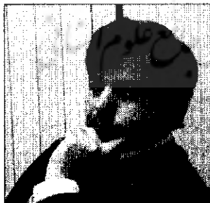
نواندیشی دینی و زن؛ تاملی در مبانی معرفتی مجید مرادی