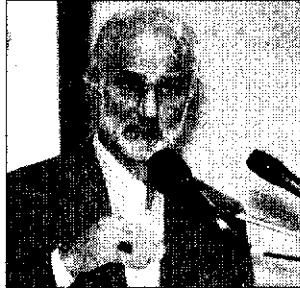
آسیب‌های اجتماعی در ایران مسحطفی معین