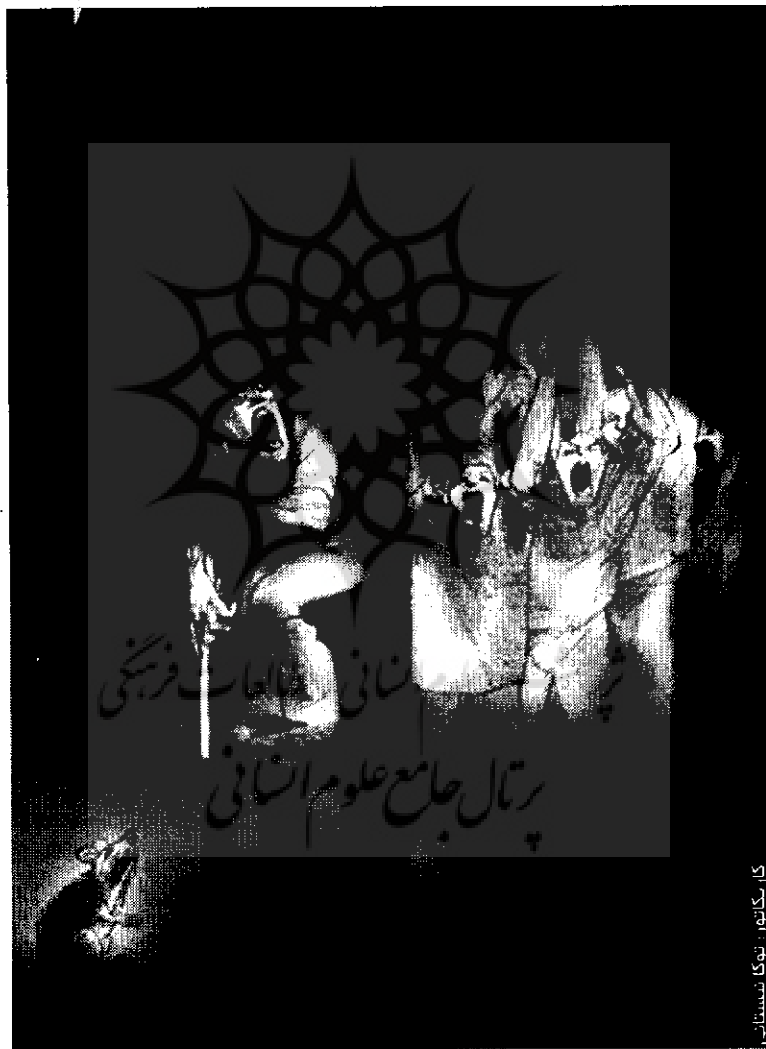
بررسی نشان از احساس ترس رتال جامع علوم انسانی

در سایر موارد، هراسی که افراد و یا گروه متحمل آن می شوند، نوعاً مرتبط با نوعی شرایط تهدیدکننده و در فاصله نزدیک و یا دور است. هراس می تواند توسط دامنه گسترده ای از شرایط ایجاد شود.