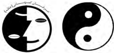
علامت بین و یانگ علامت تجاری عرفان کیهانی

گردآوری شده است. این ملغمه به همراه مخلوطی از اشعار عرفای ایرانی مانند حافظ و مولانا و صائب، و سهراب سپهری (از معاصرین) به اضافه آیات قرآنی به عنوان عرفان کیهانی در کتاب‌ها، کلاس‌ها، سمینارها و ویدئوها به فروش می‌رسد. نماد عرفان کیهانی، علامت بین و یانگ (yin and yang) است که در مرکز فلسفه چینی و طب سنتی چین قرار دارد و بیانگر این معناست که چگونه در جهان طبیعی چیزهای به ظاهر متضاد، در هم بافته و مستقل و به هم پیوسته‌اند (شکل‌های زیر را ببینید).