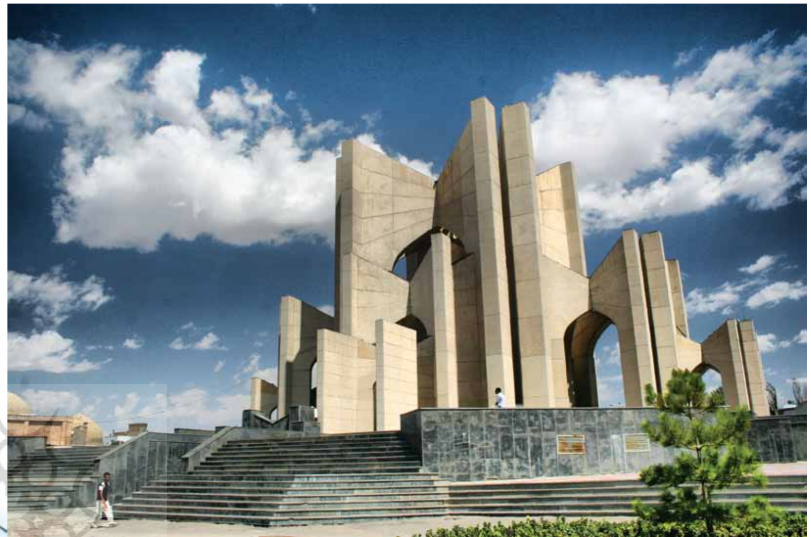
رضا ونوقی / مقبره الشعرا