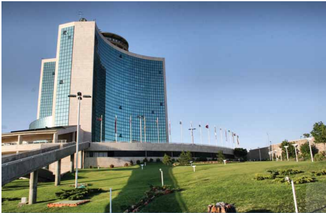
رسانا پوششی آهنگ نال کلمی