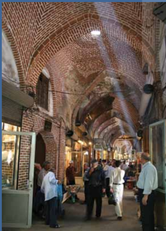
رسانا پوششی بازار تبریز