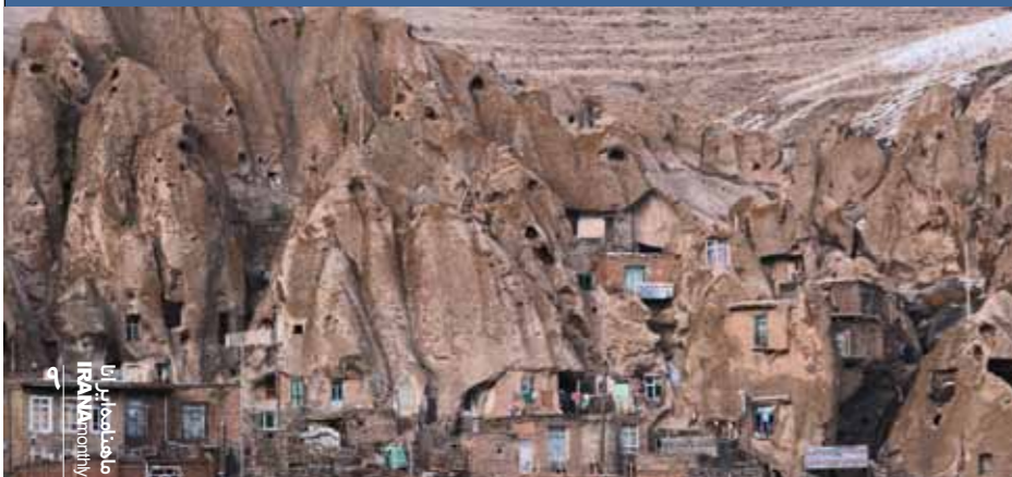
رضا وثوقی / روستای کندوان