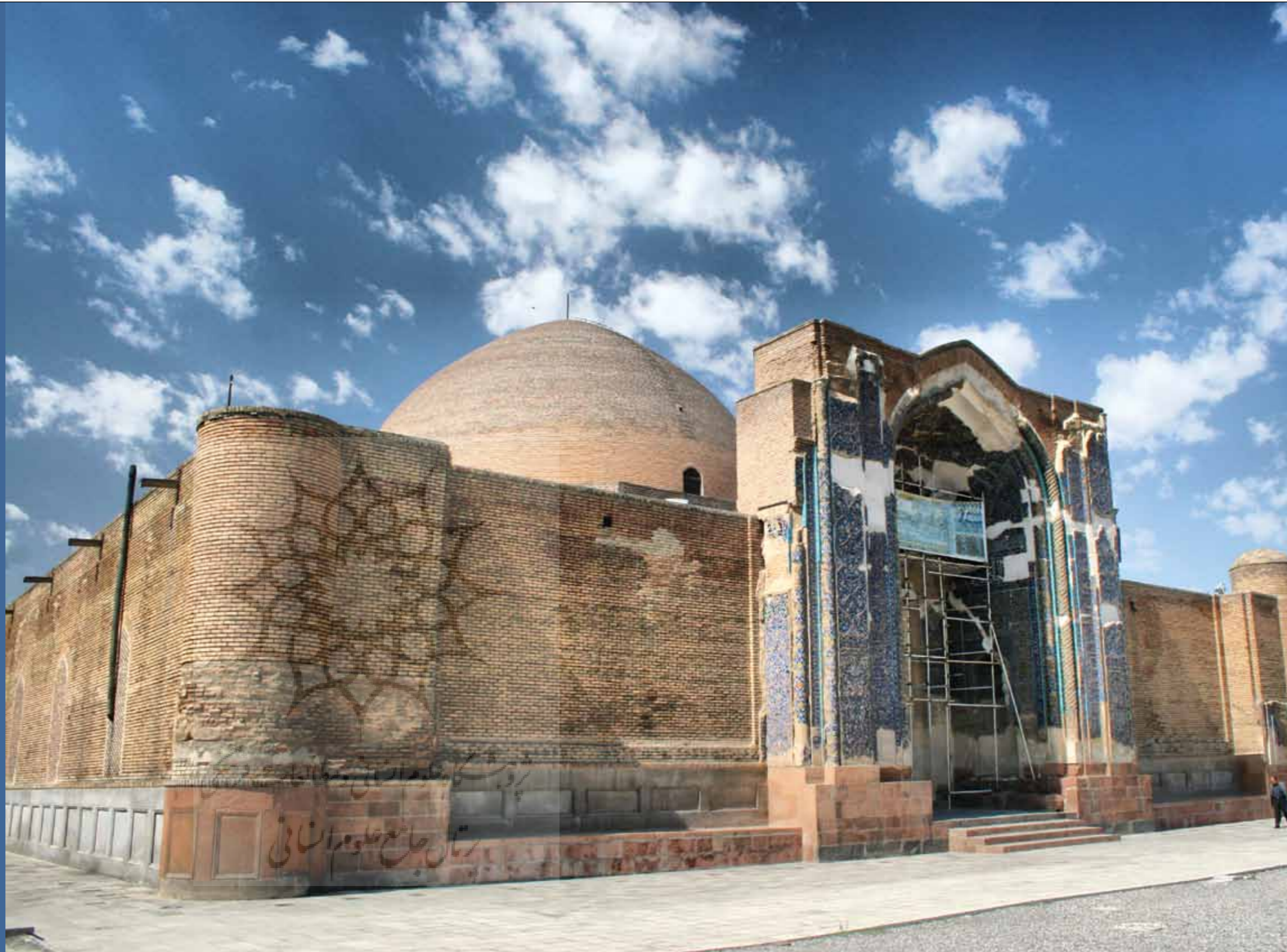
رضا وثوقی / مسجد کبود تبریز

آب و هوای معتدل کوهستانی شهرستان کلبر، به همراه جنگل‌های زیبا و منطقه منحصر به فرد و