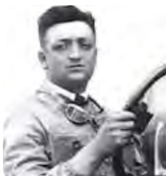
انزو فرراری جوان