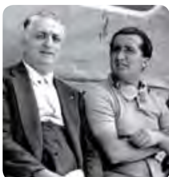
دینو فرراری و انزو فرراری