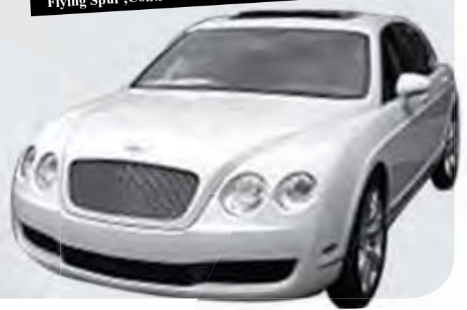
بنتلی Flying Spur ,Continental GT,Arnage