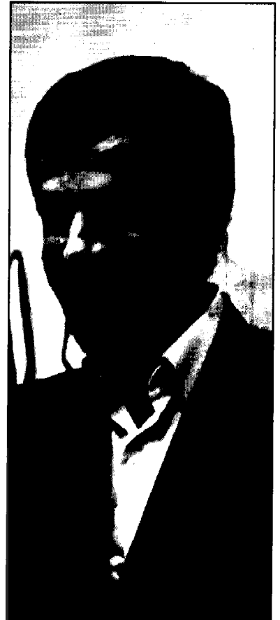
جلسات ستاد مرکزی سهام عدالت به ریاست رئیس جمهوری برگزار می شود.

و تأمین اجتماعی، رئیس بنیاد شهید و امور ایثارگران، وزیر بهداشت، درمان و آموزش پزشکی، فرمانده نیروی مقاومت بسیج، سرپرست کمیته امداد امام خمینی (ره)، رئیس سازمان بهزیستی کشور، رئیس دفتر امور مناطق محروم کشور، رئیس سازمان ثبت احوال کشور و رئیس سازمان خصوصی سازی است. اختیارات ستاد مرکزی به شرح زیر است: