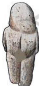
۵۸. ونوس تان تان - راین - مرگش - [۲۳، ص ۶۹]