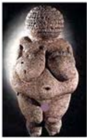
۲۷. ونوس ویلندورف - [۱۴، ص ۳۸]