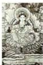
۹۷. تولد کوان بین - [۳۰، ص ۱۵۳]