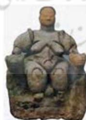
۲۰. الهه باروری - چتل هویوک - [۴۰]