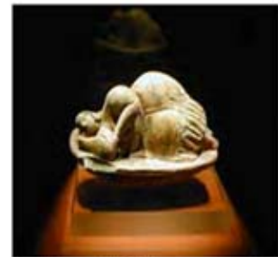
۲۳ و ۲۴. ونوس مالتا - موزه ملی مالت - ۳۳۰۰ ق.م. - [۱۲]