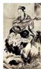
۱۰۰. بنتن - [۳۱، ص ۲۱۸]