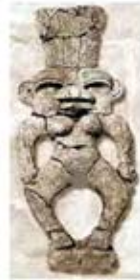
۷۰. به ست - سودان [۴۷]