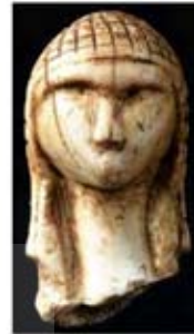
۲۹. ونوس بارسمیوی - [۱۰]