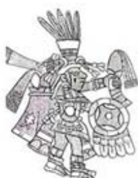
۱۱۰. سنه توتل - [۳۲، ص ۱۷۸]