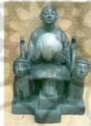
۳۷. گایا - سده ۷ ق.م. - [۱۲]