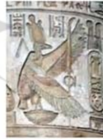
۸۰. نکیت - [۱۰]