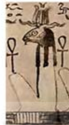
۷۵. تفنوت - [۲۷، ص ۶۷]