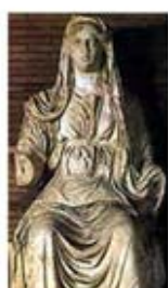
۴۹. سرس - [۲۳]