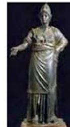
۵۱. مینروا - [۴۱]