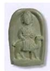
۱۷. اللات - خناسر، سوریه - سده ۱ ق.م. - [۴۰]