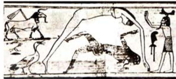
۷۴. نوت (آسمان) بر بالای جب (زمین) خیمه زده است - [۹، ص ۲۲۸]