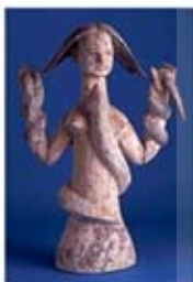
۱۵. هاسی - بابل - [۱۰]