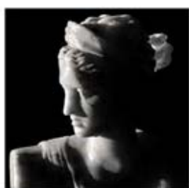
۵۰. دیانا - [۴۵]