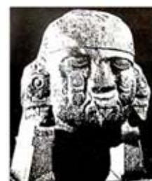
۱۱۲. کویلشاوکی - [۳۲، ص ۱۸۶]