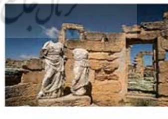
۴۱. دیومتر و پرسیفون - سیرنه - [۴۳]