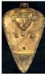
۷۷. هاتور - [۴۸]