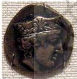
۳۸. سکه با نقش هرا - [۴۵]