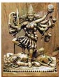
۹۱. کالی - [۱۰]