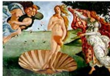
۵۲. تولد ونوس - بوتیچلی - سده ۱۵ م - [۴۶]