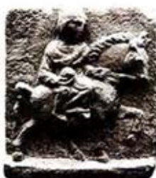
۵۵. اپونا - راین - [۲۳، ص ۳۵]