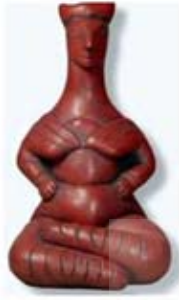
۳۳ تا ۳۴. الاهگان ماری - کرت - [۱۰]