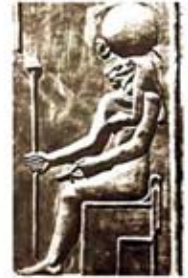
۷۹. مسخت - [۲۷، ص ۱۲۲]