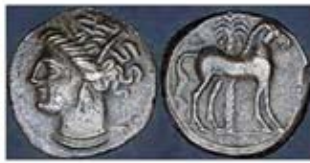
۲۵. سکه با نقش الهه باروری - کارتاز - [۲۱]