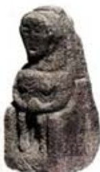
۵۴. الهه باروری - کارونت، ولز جنوبی - [۲۳، ص ۶۳]