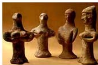
۱۰ ۱۱ و ۱۰. آشه راه - فلسطين - سده های ۱۰ تا ۷ ق.م. - [۴۲]