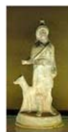
۴۵. بندیس - [۱۰]