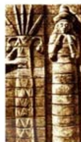
۷. تین لیل - [۱۰]