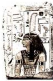
۸۳. سلکت - [۲۷، ص ۱۸۸]