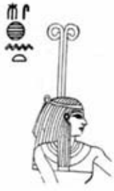
۸۴. مسخت - [۱۰]