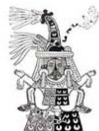
۱۰۶. تلاسوتوتل - [۳۲، ص ۱۷۷]