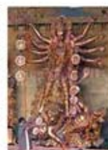
۹۲. دورگا - [۱۰]