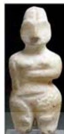
۸. الهه باروری - حسونا - حدود ۶۰۰ ق.م. - [۱۳]