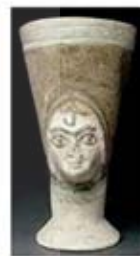
۱۲. جام - اوگاریت - سده های ۱۴ تا ۱۳ ق.م. - [۹]