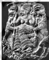
۱۳. نیک کال - اوگاریت - سده های ۱۴ تا ۱۳ ق.م. - [۹]