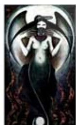
۱۱۶. ارناکواگاسک - [۱۰]