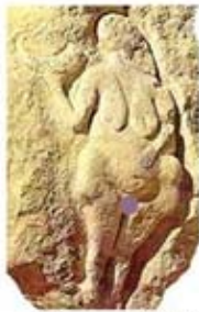
۲۶. الهه باروری - لاسال، درنی - [۴۳]