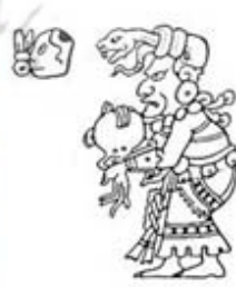
۱۱۳. ایشجل - [۳۲، ص ۲۵۷]