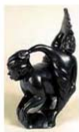
۱۱۷. سدنا - [۱۰]