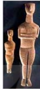
۳۰ و ۳۱. تنهای سیکلادیک - ۲۵۰۰ تا ۲۰۰۰ ق.م. - [۲۴]