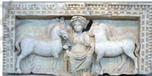
۵۶. اپونا [۴۵]