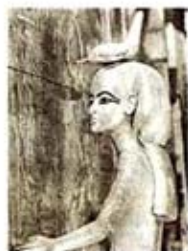
۸۵. ماعت - [۲۷، ص ۱۷۷]