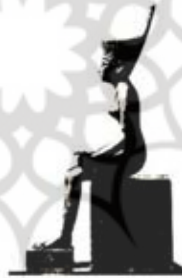
۸۱. نیت - [۲۷، ص ۱۱۸]