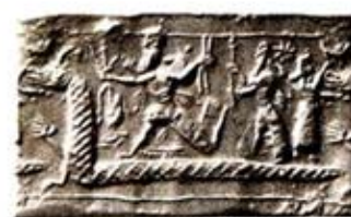
۱. کشته شدن تيامت به دست مردوخ - [۹ ص ۲۸۳]