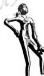
۸۷. دختر رقصان - موهنجودارو - [۲۸، ص ۱۷]