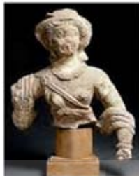
۵۳. دیانا - دورا اوریوس - سده ۲ م - [۹]