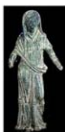
۴۷. جونو - [۴۱]