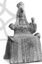
۳۶. مادر و کودک - تاناگرا، یونان - ۵۵۰ ق.م. - [۹]