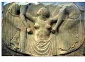
۴۳. حمام افرودیت - [۴۳]