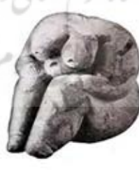
۱۹. الهه باروری - چتل هویوک - [۱۲ ص ۵۲]