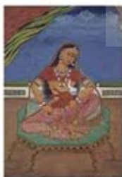
۹۰. پارواتی در حال شیر دادن به گانشا - [۱۰]