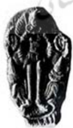
۸۹. ایزدبانوی بالدار - بساره - [۲۸، ص ۴۰]