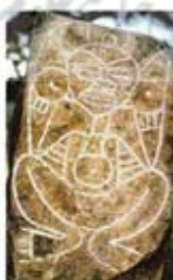
۱۱۴. اتالیبر - پورتوریکو - [۱۰]