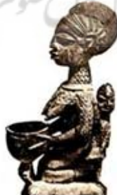
۶۴. تندیس سفالین مادر یا کودک - [۲۴، ص ۱۲۸]