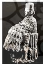
۱۴. الهه باروری - ماری - [۱۱ ص ۴۱]