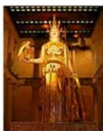
۴۶. آتنا - [۴۱]