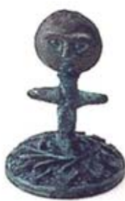
۶۷ و ۶۸ اکویا - غنا - [۲۹]