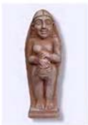
۱۶. سیدوری - سده ۸ ق.م. - [۴۰]