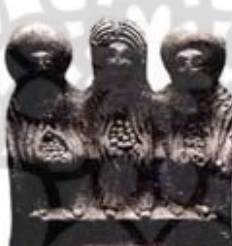
۵۷. الاحکام دانامترس - راین - طالعات [۲۳، ص ۶۹]