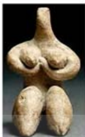
۹. الهه باروری - حلف - حدود ۵۱۰۰ تا ۶۰۰ ق.م. - [۹]