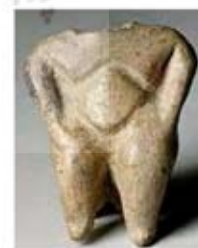
۱۸. الهه باروری - اناتولی - ۶۰۰ تا ۵۵۰ ق.م. - [۱۵ ص ۱۱۳۶]