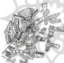
۱۰۹. چالچیتلیکونه - [۳۲، ص ۱۷۰]