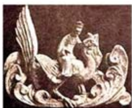
۹۸. فنگ هوآنگ - [۳۰، ص ۶۸]