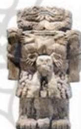
۱۰۸. کواتلیکونه - [۳۲، ص ۱۷۳]