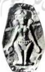
۸۸. الهه زمین - لوریا - [۲۸، ص ۳۵]