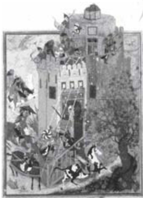
تصویر ۵ ظفرنامه تیموری، نیمه دوم قرن نهم هجری، مکتب هرات، منسوب به بهزاد

به‌ویژه در مورد دوران گوتیک و باززایش (رنسانس) در اروپا و علی‌الخصوص مناطق فلاندر و آلمان که به شدت تحت تأثیر اعتقادات مسیحی قرار داشتند و نیز در ایران قرون هشت، نه و ده هجری که مذهب همراه با عرفان و تصوف بخش مهمی از حیات فرهنگی و ادبیات ایران تشکیل می‌دادند؛ صادق می‌باشد. این چنین است که طی این دوران بزرگترین آثار هنری در فلاندر و آلمان در قالب آذین محراب‌های کلیساها و در ایران در قالب تذهیب‌گری و تصویرسازی کتب ادبی با صیغه عرفانی و مذهبی خلق می‌شوند. نقاشان مکتب فلاندر و آلمان همچون نگارگران ایرانی نسبت به بازنمایی جزئیات و تزئین اثر از طریق اهمیت دادن به جزء جزء اثر و پرداخت وسواس‌گونه آنها علاقه فراوانی دارند؛ با این حال نگارگر ایرانی نگاهی درون‌گرا دارد و توجه او معطوف به جهان درونی اثر است حال آن‌که نقاشان مکتب فلاندر و آلمان توجه به عالم بیرون و نگاهی برون‌گرا دارند. گو اینکه رویکرد هر دو گروه به اثر، در خدمت ایجاد وحدتی اندام‌وار در کل اثر و در نهایت هماهنگی مضمون با شکل اثر یا هم‌خوانی صورت و معنا می‌باشد.