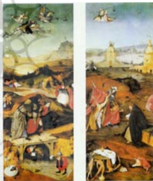
تصویر ۳ لت‌های جانبی وسوسه‌ی آنتونی قدیس. لت سمت راست: آنتونی قدیس در حال مراقبه. لت سمت چپ: پرواز و شکست آنتونی قدیس

به‌ویژه در مورد دوران گوتیک و باززایش (رنسانس) در اروپا و علی‌الخصوص مناطق فلاندر و آلمان که به شدت تحت تأثیر اعتقادات مسیحی قرار داشتند و نیز در ایران قرون هشت، نه و ده هجری که مذهب همراه با عرفان و تصوف بخش مهمی از حیات فرهنگی و ادبیات ایران تشکیل می‌دادند؛ صادق می‌باشد. این چنین است که طی این دوران بزرگترین آثار هنری در فلاندر و آلمان در قالب آذین محراب‌های کلیساها و در ایران در قالب تذهیب‌گری و تصویرسازی کتب ادبی با صیغه عرفانی و مذهبی خلق می‌شوند. نقاشان مکتب فلاندر و آلمان همچون نگارگران ایرانی نسبت به بازنمایی جزئیات و تزئین اثر از طریق اهمیت دادن به جزء جزء اثر و پرداخت وسواس‌گونه آنها علاقه فراوانی دارند؛ با این حال نگارگر ایرانی نگاهی درون‌گرا دارد و توجه او معطوف به جهان درونی اثر است حال آن‌که نقاشان مکتب فلاندر و آلمان توجه به عالم بیرون و نگاهی برون‌گرا دارند. گو اینکه رویکرد هر دو گروه به اثر، در خدمت ایجاد وحدتی اندام‌وار در کل اثر و در نهایت هماهنگی مضمون با شکل اثر یا هم‌خوانی صورت و معنا می‌باشد.