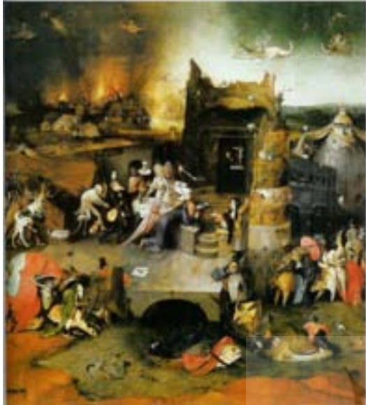
تصویر ۱ نقاشی سه‌لته‌ی وسوسه‌ی آنتونی قدیس اثر هیرونیموس بوش در اواخر قرن ۱۵ میلادی. لت مرکزی: پیروزی آنتونی قدیس

شاهد اولین جرقه‌های گرایش به زیبایی طبیعی و در نهایت طبیعت‌گرایی هستیم. حساسیت در برابر زیبایی بشری و طبیعی، که ارزشی مثبت تلقی شده است.