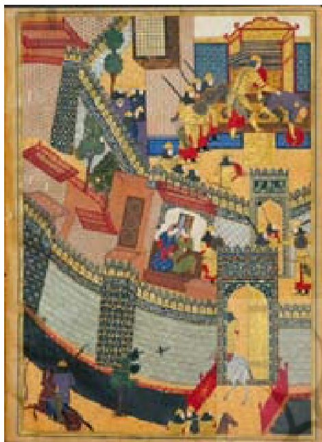
تصویر ۴ کشتن اسفندیار ارجاسب را در روین دژ، شاهنامه بایسنقری، مکتب هرات نیمه اول قرن نهم هجری

ناپیدا و ناگفته‌های تاریخ، نور حقیقت تاباند؛ اگرچه هنر خود توصیف‌گر خویش است و بهترین شاهد تاریخ. هنرمند را گریزی از ثبت وقایع و جهان پیرامون خود نیست پس اثر او پاسخ‌گوی بسیاری از مجهولات تاریخ است.