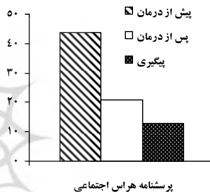
پوشنامه هراس اجتماعی

پی‌گیری کاهش یافته است که در مجموع نشان‌دهنده‌ی کاهش زیادی است. هم‌چنین با توجه به نمودار ۲، شیب نمودار در مورد هر دو مقیاس ترس از ارزیابی منفی و اجتناب و آشفتگی اجتماعی پس از جلسات خط پایه و پس از دومین جلسه‌ی درمان، به صورت نزولی به تدریج زیاد شده و نشان‌دهنده‌ی تاثیر قابل ملاحظه درمان بر کاهش نمرات مقیاس‌های ذکر شده است. ضمن این که این تاثیر نه تنها در مرحله‌ی پی‌گیری از بین نرفته است، بلکه حتی نسبت به آخرین مرحله‌ی درمان نیز اندکی بیشتر شده است. به طوری که نمرات هر دو مقیاس در مرحله‌ی پی‌گیری، کمتر از آخرین مرحله‌ی درمان شده است.