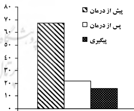
پوشنامه فراشناخت هراس اجتماعی

نمودار ۱- نمرات پیش از درمان، پس از درمان و پی‌گیری در مقیاس‌های هراس اجتماعی و فراشناخت هراس اجتماعی