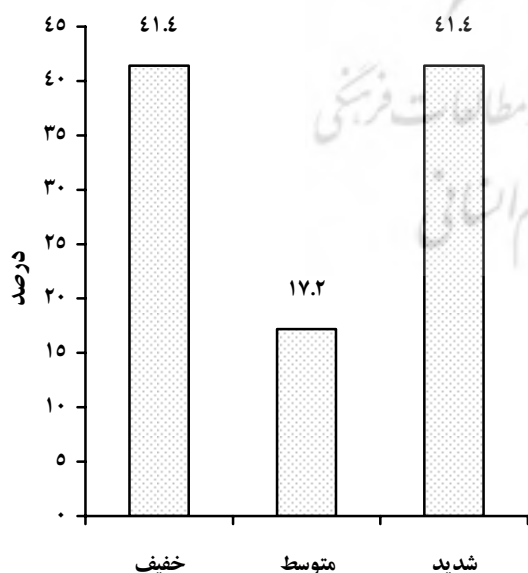
شدت بیماری پسوریازیس

نمودار ۱- شدت بیماری پسوریازیس در افراد مبتلای مراجعه‌کننده به درمانگاه‌های پوست شهرستان سمنان در طول نیمه‌ی اول سال ۱۳۸۷