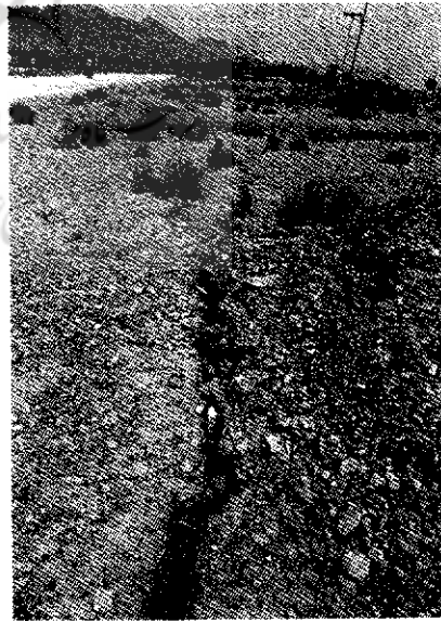
تصاویر ۱ و ۲- شکافهای دشت مهیار و اثر آنها بر روی دیوارها