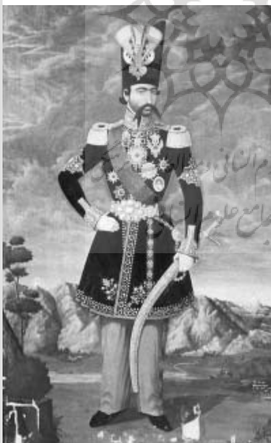
تصویر ۲- ناصرالدین شاه عمل محمد حسن افشار ۱۲۷۶ ه. ق

آبرای مدتی در انبار چهل ستون باقی می‌ماند سپس