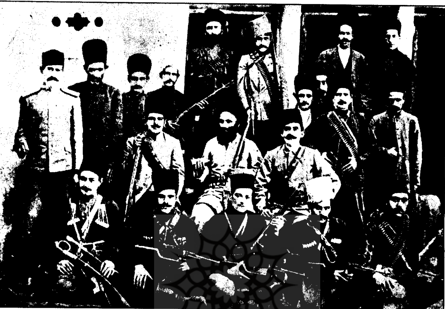
تصویری از مشروطه خواهان اصفهان

اولین شماره مجله دانشکده اصفهان را منتشر کرد. مجله دانشکده در دو دوره و دوازده شماره انتشار یافت «این مجله اخلاقی - علمی و ادبی متضمن اشعار اعضای انجمن دانشکده و حاوی مباحث ادبی و منظومه های اخلاقی بود و بیشتر مقالات آن به قلم خود شیدا که مدیر مجله بود، نگارش می یافت.» ۴