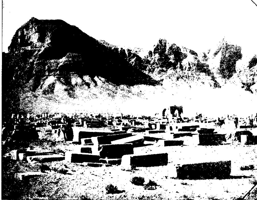
قبرستان آرامنه از کتاب ارزشمند ار نست هولستر «اصفهان در یکصد و سیزده سال پیش»