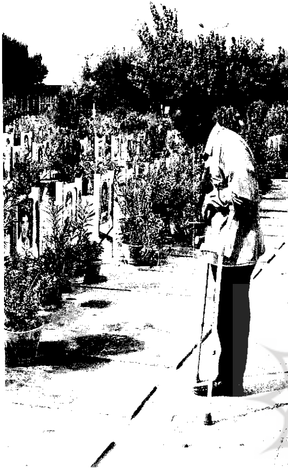
مورد شهیدپروری اصفهان فرمودند:

و آخرین حماسه‌ای که اصفهان فعالانه در آن شرکت جست، دفاع مقدس بود که با تقدیم ۲۳۰۰۰ شهید در رتبه اول کشور قرار گرفت تا جایی که حضرت امام خمینی(ره) در