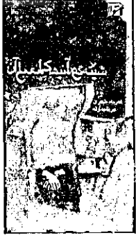
شیشه گورانبه کانی باران فریاد شبیری ناشر: شولا تیراژ: ۱۰۰۰ جلد