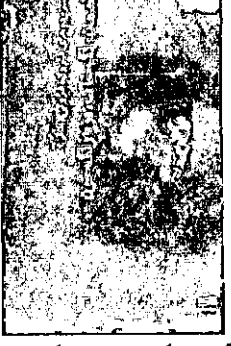
آسمان رنگ خاک، دریا رنگ خون فیروزه فزونی (ساقی) ناشر: تیراژ: ۳۰۰۰ جلد