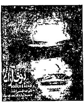
بوق آزاد نوشته: علیرضا تهمتنی (ایلیا) ناشر: مولف تیراژ: ۲۸۰۰ جلد