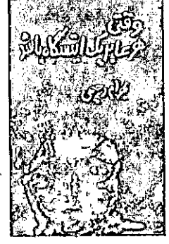
وقتی هر عابر بر یک ایستگاه باشد بهرام رحیمی ناشر: صمدیه تیراژ: ۱۰۰۰ جلد