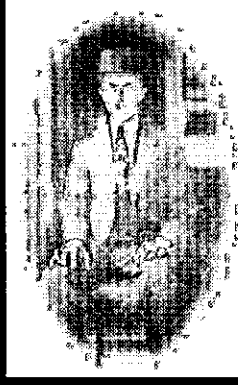
گزارشی از گرامیداشت صد سالگی صادق هدایت در نگارخانه سامی

بدنبال دعوت کانون نویسندگان ایران، به منظور بزرگداشت، صدمین سالگرد تولد صادق هدایت در تاریخ ۱۶ تیرماه جاری نشستی با حضور گروه زیادی از علاقمندان به ادبیات، در کنار تعدادی از نویسندگان و شاعران، در نگارخانه سامی برگزار گردید.