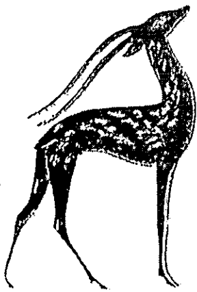
آهوی تنها - نقاشی صادق هدایت

نشانی پستی: تهران - صندوق پستی ۷۷۸۵/۱۷ تلفن: ۲۵۲۷۷۹ حروف چینی: زهرمشورآبادی امور فنی و هنری: مجتبی لسنکندر - تلفن ۸۹۵۰۲۷۶ لیتوگرافی: درنا چاپ: چاپ و نشر تهران پست الکترونیک: parvinmagazine@hotmail.com