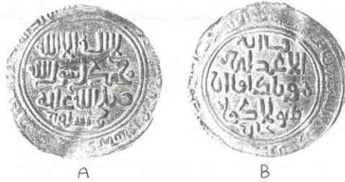
سکه هولاکو خان مغول

سکه‌ها به تدریج تحت تاثیر فرهنگ مغول قرار گرفته و با اینکه بیشتر شاهان این دوره ظاهراً به اسلام مشرف شده و نام اسلامی برای خود انتخاب نموده بودند، ولی نام والقب خود را با کلمات ایغوری نوشته‌اند. در برخی سکه‌ها فقط نام سلطان با حروف فارسی نوشته شده؛ آن هم برای شناخته شدن پادشاه جدید از فرمانروای قبلی. سلاطین این دوره عبارتند از: اباقا، احمد تگودار، ارغون، گیخاتو، بایدو و غازان محمود.