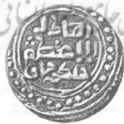
سکه چنگیز خان مغول

تفحص در سکه‌های چنگیزخان نشان‌دهنده گرایش سیاسی خاص نیست. در هم نقره باقی مانده به نام وی که در سال ۶۲۵ هجری ضرب شده است، با عبارت «العادل الاعظم چنگیزخان» است. از آنجایی که این سکه با خط عربی «العادل الاعظم» و نام فارسی «چنگیزخان» ضرب شده، می‌توان عنوان کرد که تحت تأثیر دیوانسالاری ایرانی قرار داشته است. با اینکه چنگیز در سال ۶۲۵ فوت نموده و این سکه پس از مرگ او ضرب شده است، متعلق به دوره او محسوب می‌شود، چون هنوز هیبت و نفوذ و احترام به وی باقی بود و تا بهار ۶۲۶ هجری که اوکتای، فرزندش به صورت رسمی جانشین پدر شد، در برخی ایالات سکه به نام چنگیز ضرب می‌شد.