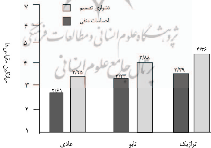
نمودار ۲. میانگین مقیاس‌ها برای دشواری تصمیم و احساسات منفی به‌عنوان تابعی از نوع بده بستان